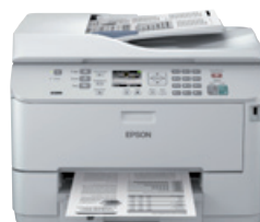
WorkForce Pro WP-M4525 DNF