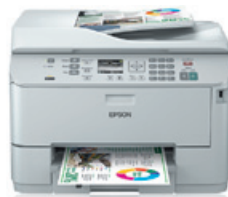
WorkForce Pro WP-4525 DNF