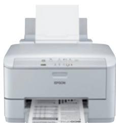
WorkForce Pro WP-M4015 DN