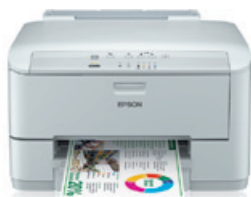
WorkForce Pro WP-4015 DN